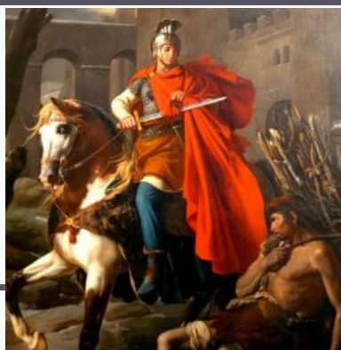
St Martin de Tours

Cette scène permet d'illustrer l'impératif de visiter les malades mais également vêtir ceux qui sont nus par le geste de déchirer sa cape. Ce comportement fait allusion à une scène bien connue de l'art chrétien, saint Martin de Tours partageant son manteau et qui illustre l'appel à vêtir ceux qui sont nus.